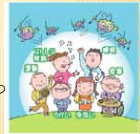
表2を見て下さい。これは我々がストレスに遭遇した時に、どういう反応を示すか、又、それによって実際、人体に生理学的にどういった違いが起きるかを示したものです。結論から言うと、ストレスを乗り越える鍵は、ストレスそのものをプラス思考で捉え、プラスに転じて行く姿勢です（これを楽観主義といいます）。β-エンドルフィンの恩恵も受け、喜びと感謝の身も心も軽くなる生き方となります。逆にマイナス思考の世界（悲観主義といいます）では、不平、不満、愚痴に伴う交感神経の過緊張を招き副腎皮質ホルモンの増加から活性酸素の体内産生の増加を招きます。これが動脈硬化の進行、老化を促し脳・心血管障害を起こし、発癌物質として悪影響を与えます。医学上は一応、結論は出ていますね。皆さんはどちらを選ばれますか？勿論、楽観主義に決まっていますね。しかし、そうしたくても出来ない、あるいはあまりに強烈なストレスにどうしようもなく押し潰され悶々とせざるを得ないのが現実ですね。では、どうすればいいのか？