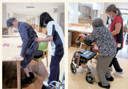
生活リハビリの様子

これからも様々な活動や練習を通して、利用者様の生活をより豊かに楽しいものにできるよう支援を続けていきたいと思っております。